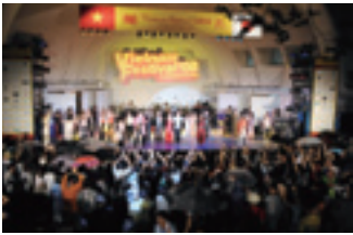
ベトナムフェスティバル2008 (15万人来場)