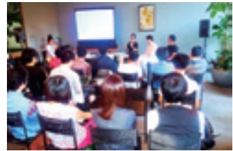
若い世代と政治を考えるイベント 「My Policy Lab」(2012.8)