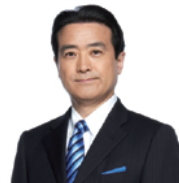
みんなの党 幹事長 衆議院議員