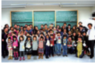
子どもたちとのワークショップ(NPO活動)