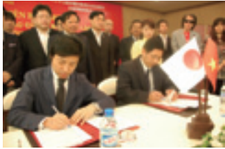
ベトナム政府観光局日本支局設立調印式