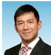
みんなの党 参議院議員