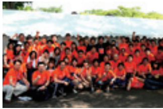
代々木公園で開催した 被災地復興支援イベント