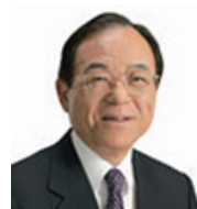
元国務大臣 前参議院議員